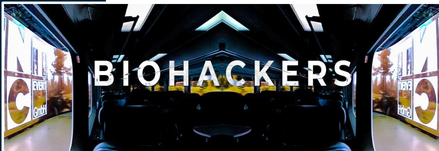
Les media serveurs Picturall Pro pilotent les murs d'images LED pour la série télévisée "BioHackers" (Rent Event Tec - Allemagne)