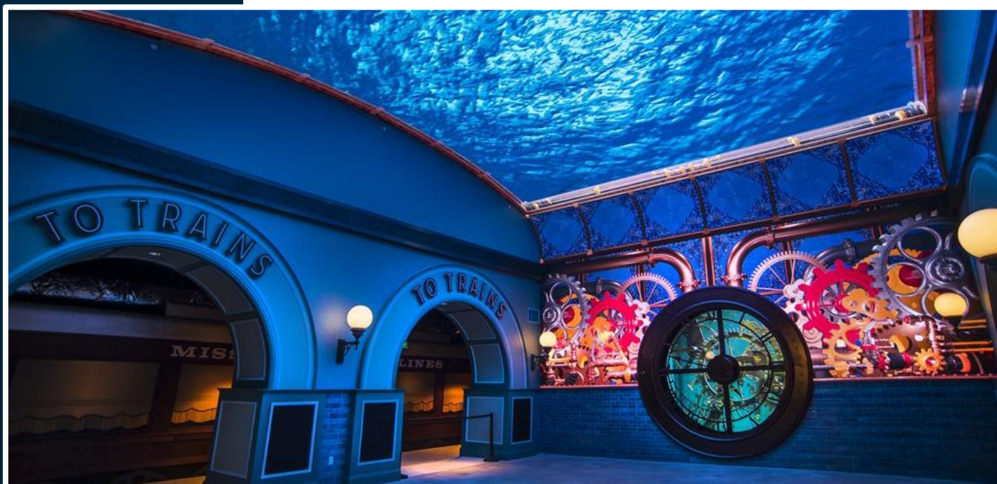
Un média serveur Picturall Pro pilote les murs d'images LED de l'entrée du nouvel aquarium de Saint-Louis (États-Unis)